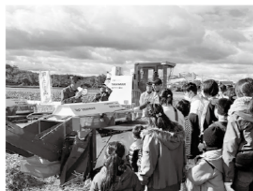
コンバインを見学中

本イベントは、マルサンアイが育成に協力した、豆乳に適した大豆「すみさやか」のプロモーション活動であり、子どもたちに大豆の魅力を知ってもらうためのものです。収穫・脱粒体験の他、コンバイン見学・豆搾み大会・豆乳試飲・大豆のポン菓子試食などが行われ盛り上がりを見せました。