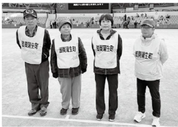
出場選手 (写真左から)

当日はJA滋賀蒲生町代表選手含め、各JAの代表選手263名が優勝を目指して熱戦を繰り広げられ、出場選手の鮮やかなクラブさばきやホールインワン等に拍手が送ら