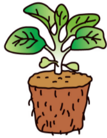
本葉4~5枚の 苗に仕上げる

陽春のころにぎやかに咲き乱れる菜の花よりもひと足早く、大きく膨らんだつぼみを持つナバナが店頭に並びます。花蕾（からい）と若い茎葉を共に食べる野菜です。